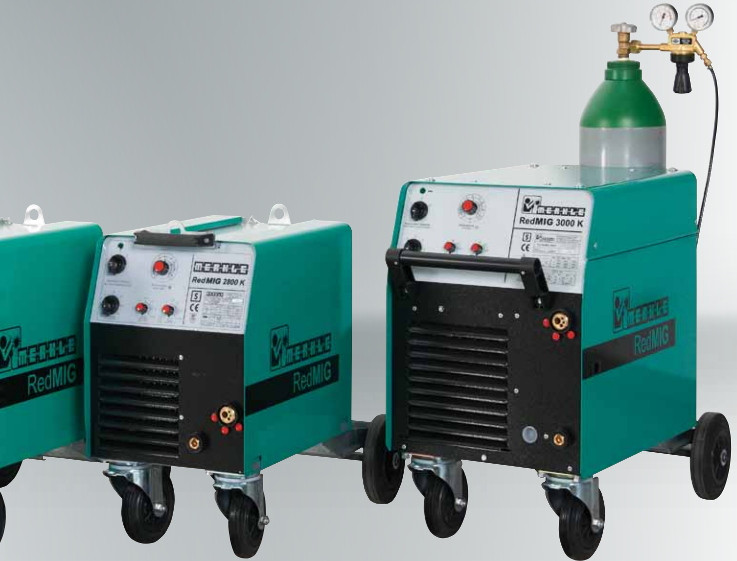
RedMIG 2800 K