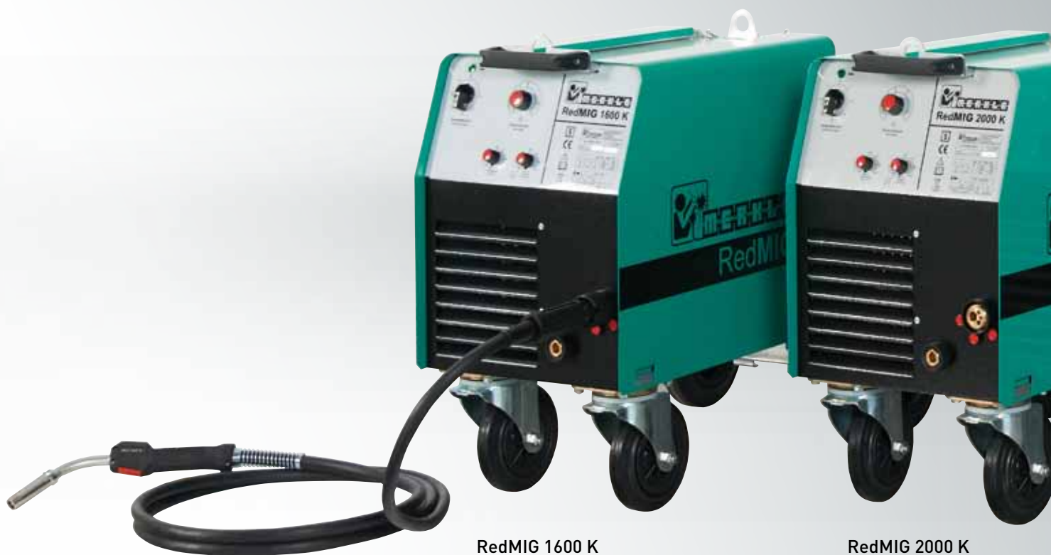
RedMIG 1600 K