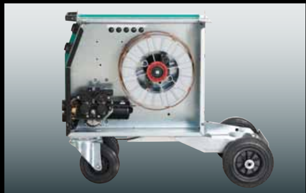
Drahtvorschubsystem und Drahtspule sind übersichtlich und leicht zugänglich angeordnet.