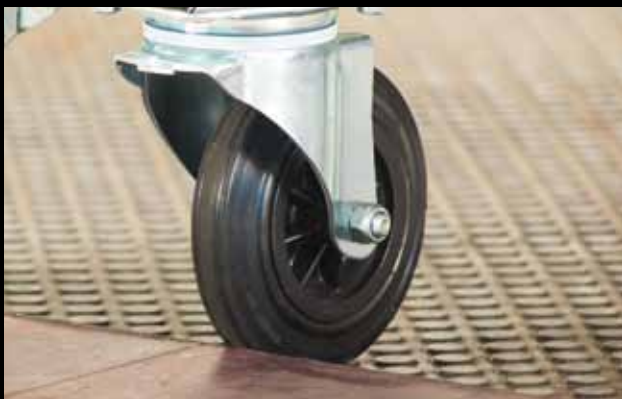
Neue, extragroße Lenkrollen (160 mm) und komfortable Bockrollen (200 mm)