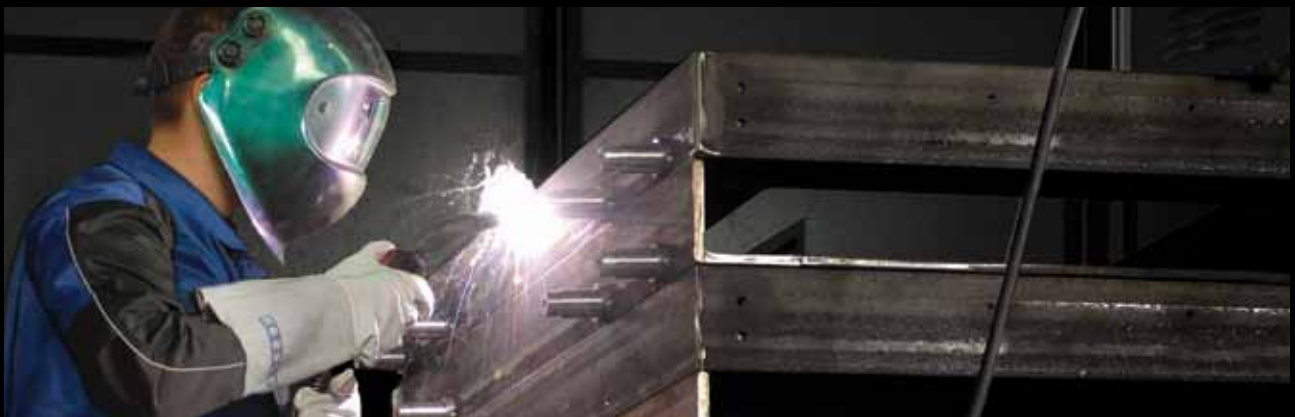
RedMIG 3000 K